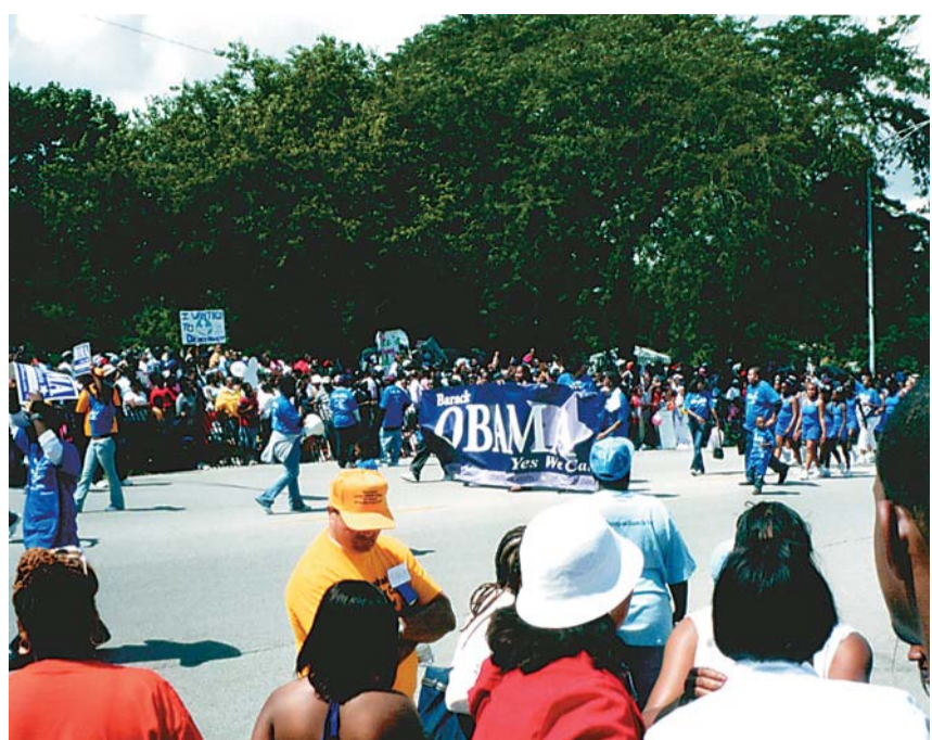
シカゴのビリケン・パレードに参加したオバマの支持者一同が行進。Obamaと書かれた右下に彼の一貫したスローガンYes We Canが見える(2004年8月14日)